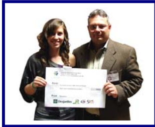
Coopérative Jeunesse de services MDJ 12-17 Région Beauharnois-Salaberry

En juillet 2009, 2 projets subventionnés ont démarré dans chacune des MRC. Ces projets se veulent formateurs pour nos jeunes et la Fondation « Notre relève en affaires » agit comme organisme associé. La Coopérative jeunesse de services Jeuneficace de la région du Haut-Saint-Laurent et la Coopérative jeunesse de services MDJ 12-17 de Salaberry-de-Valleyfield permettent à la communauté d'encourager les jeunes à développer leurs compétences tout en facilitant la tâche pour les menus travaux à la maison.