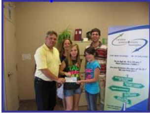
Coopérative Jeunesse de services Jeuneficace Région Haut-Saint-Laurent